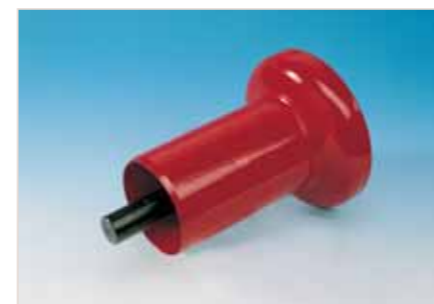
Trap 281 19120151 Trap 221 19120152 Trap 202 19120153 Trap 161 19120154