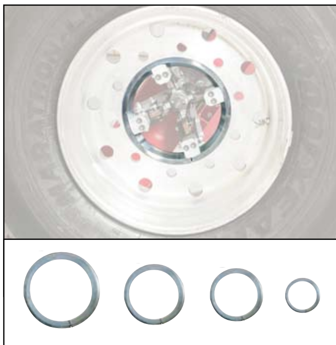
Anelli di bloccaggio cerchi in lega (TRAP) Clamping rings for alloy rims (TRAP)