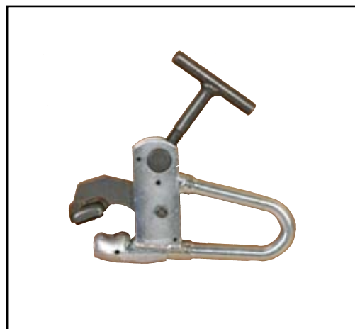
Pinza per cerchi in lega Wheel clamp for alloy rims